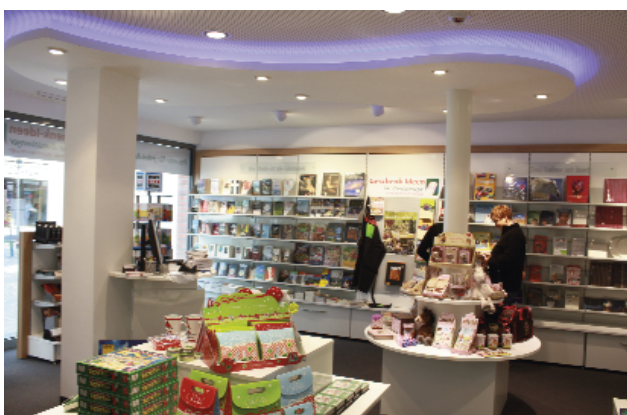
Zweites Kennzeichen bei Bunselmeyer sind die offenen Übergänge von der Verkaufsfläche zur Mall.