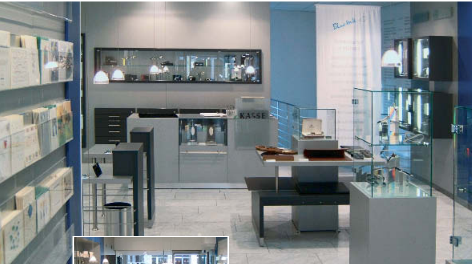
Durchblick: „Blue Ink“ lädt zum Stöbern und Ausprobieren ein.